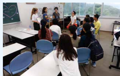
「真夏の未来トレジャーハント」の様子