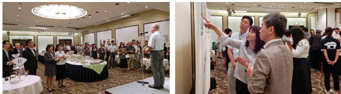
交流会場でのポスター発表

活動団体8組、研究者2名のステージ発表の後、34組の団体に交流会会場でポスター発表を行っていただきました。ポスター発表では、発表者同士で積極的に意見交換をして、お互いの今後の活動の参考とされている光景が見られました。