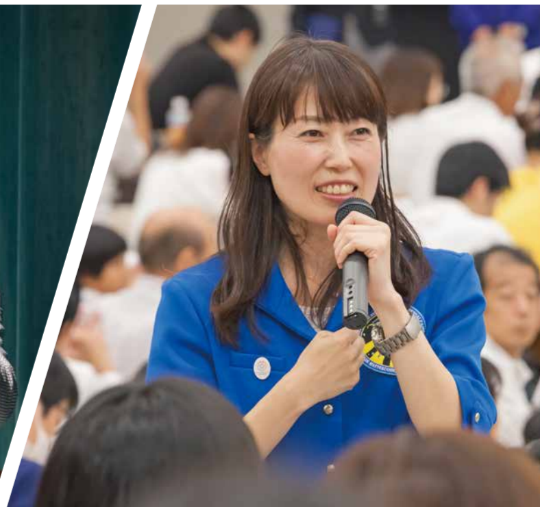
第3回いのちのセミナー 講師：山崎 直子氏